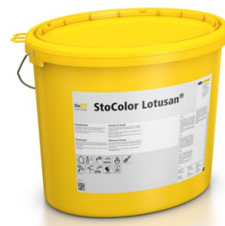
Enduit StoColor Lotusan® aux propriétés autonettoyantes

Agence FP&A - Céline GAY 01 30 09 67 04 - 07 61 46 57 31 celine@fpa.fr