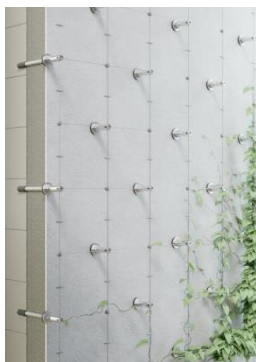
Nouveau système StoFix Iso-Bar ECO pour végétaliser les façades