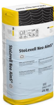
Nouveau sous-enduit d'ITE StoLevell Neo AimS®