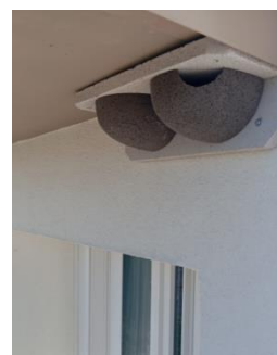
Nichoir StoElement Fauna en applique de façade pour les hirondelles de fenêtre