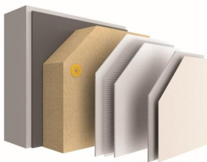
Nouveau système ITE StoTherm Wood AimS® avec isolant en fibre de bois